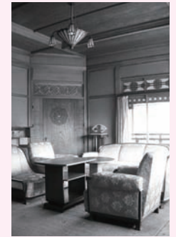
秋の特別公開日 9/10(土) 10/10(日祝) 11/ 5(土)