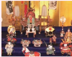
端午の節句飾り 4/13(水)～5/13(金)