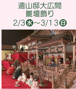
遠山邸大広間 雛壇飾り 2/3(水)～3/13(日)