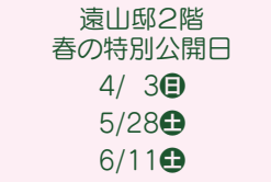
遠山邸2階 春の特別公開日 4/ 3(日) 5/28(土) 6/11(土)